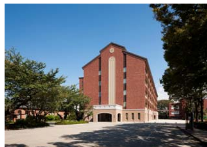
女子中・高等科新教室棟