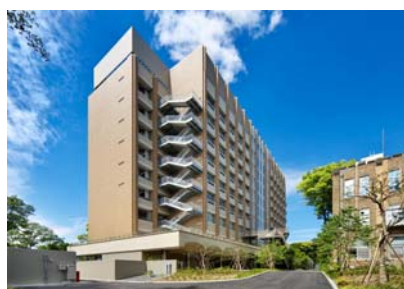
自然科学研究棟 (南7号館)